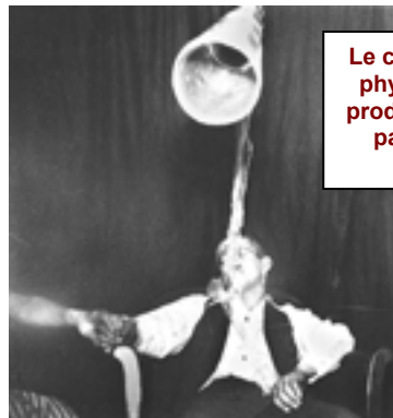
Le célèbre médium à effets physique, Leonard Scott, produisant une "trompette" par laquelle les entités parlaient.

Alan Pemberton : Puis-je vous arrêter là parce que les gens pourraient être un petit peu perplexes quand on parle de la trompette. Une trompette est utilisée dans ces séances pour amplifier la voix, c'est bien ça ?