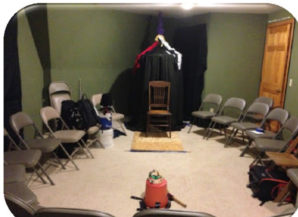
Disposition typique d'une salle réservée aux séances de médiumnité physique

Il s'en suivit alors une remarquable lévitation de notre table. Elle se trouva encore complètement détachée du plancher, en suspension dans l'air à hauteur de mes yeux pendant plusieurs secondes. Elle monta davantage de quelques centimètres, si bien que je dû me lever pour garder mes mains sur la surface de la table. Ensuite, elle s'abassa doucement, mais au lieu d'atterrir sur le plancher, elle se souleva à nouveau sur