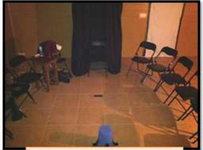
La salle de réunion avec le cabinet du médium au fond

Cette séance fut la deuxième des trois qui furent tenues lors du séminaire de médiumnité physique au centre Rob et Barbara McLernon's Acacia (Los Molinos près de Balsicas) à Murcia dans la région de la Costa Blanca en Espagne.