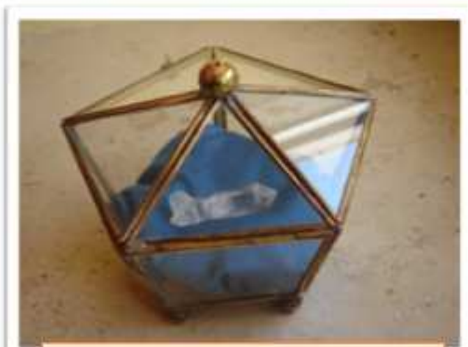
Cristal matérialisé lors d'une autre séance