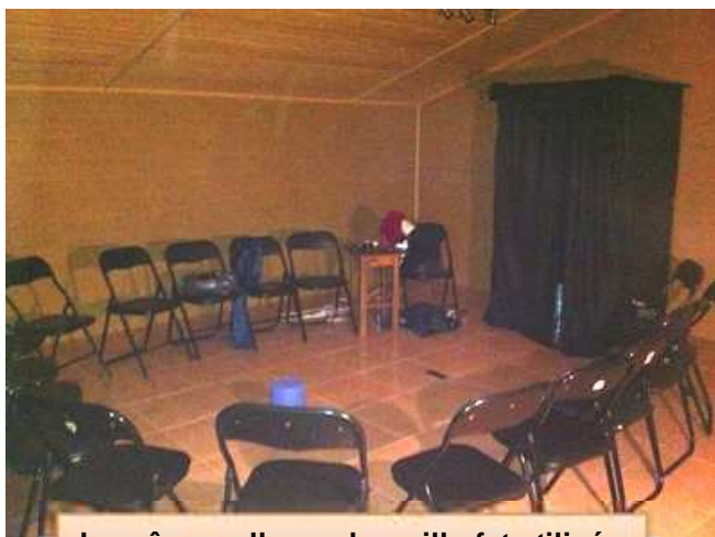
La même salle que la veille fut utilisée

Afin de ne pas alourdir le texte et faire trop de répétitions au regard du précédent rapport, je n'ai retenu que certains passages apportant des compléments intéressants.