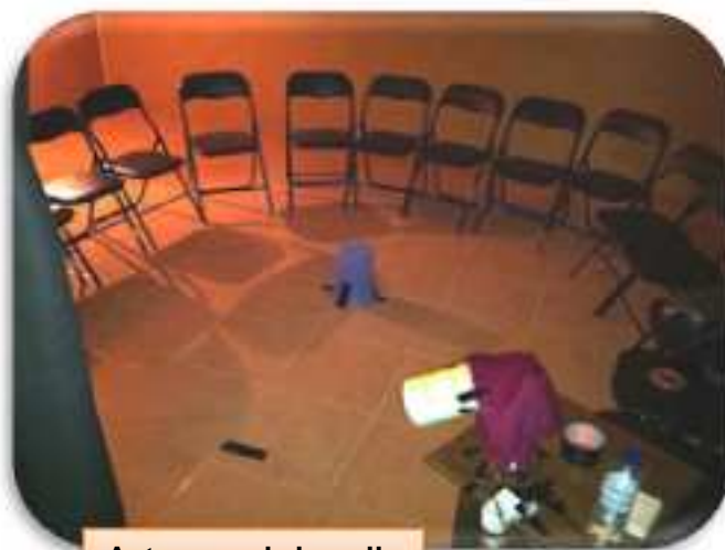
Autre vue de la salle

Certains participants furent touchés par les mains des esprits, soit sur leurs genoux ou leurs bras. Quelques-uns ressentirent de douces caresses des esprits sur leur visage ou dans leurs cheveux, tandis que d'autres ont rapporté avoir ressenti une interaction avec ce qu'ils ont défini comme un petit animal (souvent comme une araignée) sur leurs jambes.