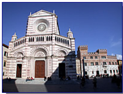
Vue de Grosseto