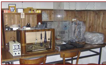
Poste de radio de Marcello

MF : Il est ici, il est ici Amerigo... nous sommes en train de t'écouter.