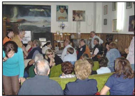
Vue arrière de la salle

Cela est intéressant d'ailleurs, car n'oublions pas que pour la Tci telle que nous la pratiquons, il y a aussi des problèmes de réception. Ne serait-ce pas alors une sorte de confirmation que la multiplication des ondes terrestres, avec les mobiles notamment, est gênante pour les communications ?