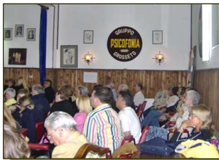
Vue de côté de la salle

Réponse (en français) : D'après vous qui connaît absolument tout sur tout.